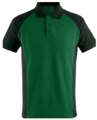
MASCOT® Bottrop Polo-Shirt 50569-961 Seite 48