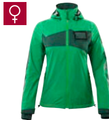
18011-249-33303 Hard Shell Jacke, Damenpassform, winddicht und wasserabweisend, geringes Gewicht