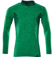
18081-810-33303 Polo-Shirt, feuchtigkeitstransportierendes COOLMAX® PRO, Langarm, moderne Passform