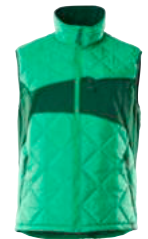
18065-318-33303 Winterweste mit CLIMASCOT®-Futter, wasserabweisend, geringes Gewicht