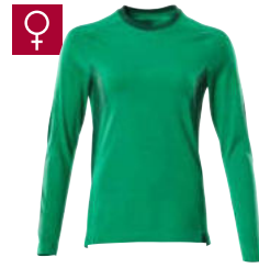
18391-959-33303 T-Shirt, Langarm, Damenpassform