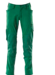
18479-311-03 Hose mit CORDURA®-Knietaschen, Vier- Wege-Stretchstoff, geringes Gewicht