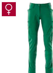
18178-511-03 DIAMOND 18188-511-03 PEARL Hose mit Schenkeltaschen, Damenpassform, Vier-Wege-Stretchstoff, geringes Gewicht