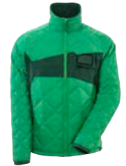
18015-318-33303 Jacke mit CLIMASCOT®-Futter, wasserabweisend, geringes Gewicht