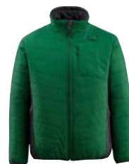
MASCOT® Erding Thermojacke 15615-249 Seite 55