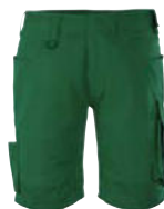
MASCOT® UNIQUE Shorts 18349-230 Seite 45