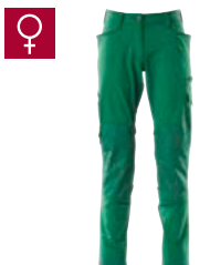
18078-511-03 DIAMOND 18088-511-03 PEARL Hose mit CORDURA®-Knietaschen, Damenpassform, Vier-Wege-Stretchstoff, geringes Gewicht