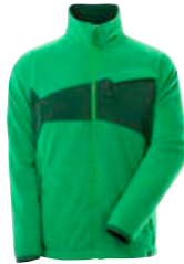
18303-137-33303 Fleecejacke mit Reißverschluss, moderne Passform