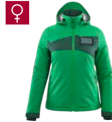
18345-231-33303 Winterjacke mit CLIMASCOT®-Futter, Damenpassform, atmungsaktiv, wind- und wasserdicht