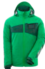
18001-249-33303 Hard Shell Jacke, winddicht und wasserabweisend, geringes Gewicht