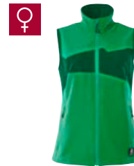
18375-511-33303 Weste, Damenpassform, Vier-Wege- Stretchstoff, geringes Gewicht