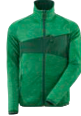
18103-316-33303 Fleecepullover mit Reißverschluss, moderne Passform