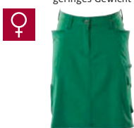
18147-511-03 DIAMOND 18347-511-03 PEARL Rock, Damenpassform, Vier-Wege- Stretchstoff, geringes Gewicht