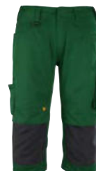
MASCOT® Altona Dreiviertel-Hose mit Knietaschen 14149-442 Seite 46