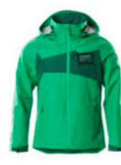
18301-231-33303 Hard Shell Jacke, atmungsaktiv, wind- und wasserdicht