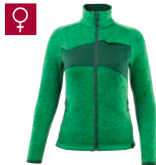
18155-951-33303 Strickpullover mit Reißverschluss, Damenpassform