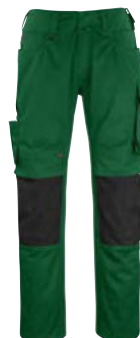
MASCOT® Erlangen Hose mit Knietaschen 12179-203 Seite 44