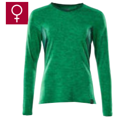
18091-810-33303 T-Shirt, Damenpassform mit feuchtigkeitstransportierendes COOLMAX® PRO, Langarm und V-Ausschnitt