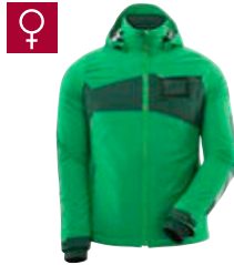
18045-249-33303 Winterjacke mit CLIMASCOT®-Futter, Damenpassform, winddicht und wasserabweisend