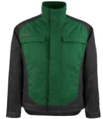
MASCOT® Mainz Jacke 12009-203 Seite 37