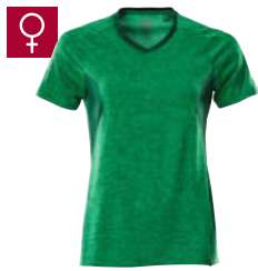
18092-801-33303 T-Shirt, Damenpassform mit feuchtigkeitstransportierendes COOLMAX® PRO und V-Ausschnitt