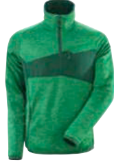
18003-316-33303 Fleecepullover mit kurzem Reißverschluss, moderne Passform