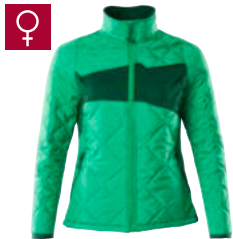
18025-318-33303 Jacke mit CLIMASCOT®-Futter, Damenpassform, wasserabweisend