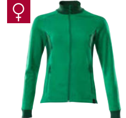
18494-962-33303 Sweatshirt mit Reißverschluss, Damenpassform