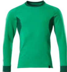
18384-962-33303 Sweatshirt, moderne Passform