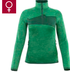
18053-316-33303 Fleecepullover mit kurzem Reißverschluss, Damenpassform