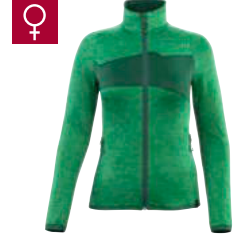
18153-316-33303 Fleecepullover mit Reißverschluss, Damenpassform