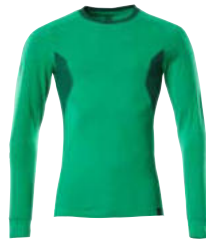
18381-959-33303 T-Shirt, Langarm, moderne Passform