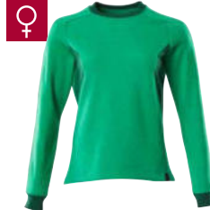
18394-962-33303 Sweatshirt, Damenpassform