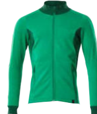
18484-962-33303 Sweatshirt mit Reißverschluss, moderne Passform