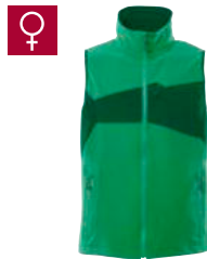
18365-511-33303 Weste, Vier-Wege-Stretchstoff, geringes Gewicht