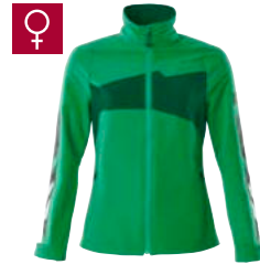
18008-511-33303 Jacke, Damenpassform, Vier-Wege- Stretchstoff, geringes Gewicht