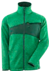
18105-951-33303 Strickpullover mit Reißverschluss, moderne Passform