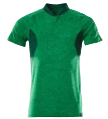
18083-801-33303 Polo-Shirt, feuchtigkeitstransportierendes COOLMAX® PRO, moderne Passform