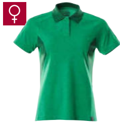
18393-961-33303 Polo-Shirt, Damenpassform