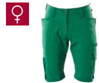
18048-511-03 DIAMOND 18044-511-03 PEARL Shorts, Damenpassform, Vier-Wege- Stretchstoff, geringes Gewicht