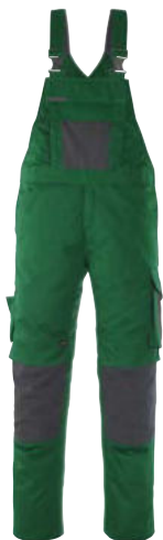
MASCOT® Leipzig Latzhose mit Knietaschen 12069-203 Seite 37