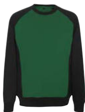
MASCOT® Witten Sweatshirt 50570-962 Seite 56