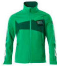
18101-511-33303 Jacke, Vier-Wege-Stretchstoff, geringes Gewicht