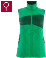
18075-318-33303 Winterweste mit CLIMASCOT®-Futter, Damenpassform, wasserabweisend