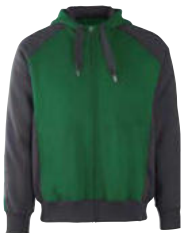
MASCOT® Wiesbaden Kapuzensweatshirt mit Reißverschluss 50566-963 Seite 42