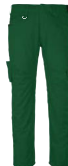
MASCOT® Dortmund Hose 12079-203 Seite 36