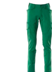
18279-511-03 Hose mit Schenkeltaschen, Vier-Wege- Stretchstoff, geringes Gewicht