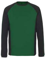
MASCOT® Bielefeld T-Shirt, Langarm 50568-959 Seite 47