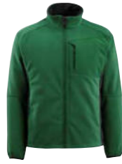
MASCOT® Marburg Fleecejacke 15603-259 Seite 56