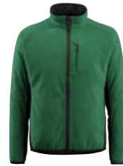
MASCOT® Hannover Fleecejacke 16003-302 Seite 36