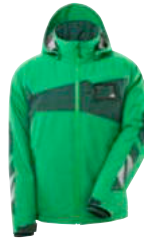
18335-231-33303 Winterjacke mit CLIMASCOT®-Futter, atmungsaktiv, wind- und wasserdicht