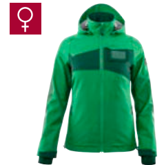
18311-231-33303 Hard Shell Jacke, Damenpassform, atmungsaktiv, wind- und wasserdicht