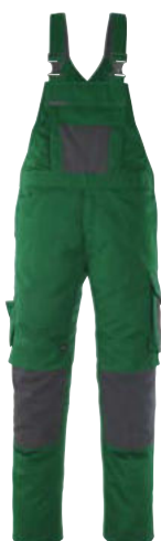
MASCOT® Augsburg Latzhose mit Knietaschen 12169-442 Seite 35