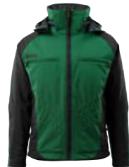
MASCOT® Darmstadt Winterjacke 16002-149 Seite 52