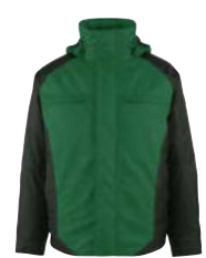
MASCOT® Frankfurt Winterjacke 12035-211 Seite 51