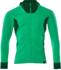
18584-962-33303 Kapuzensweatshirt mit Reißverschluss, moderne Passform