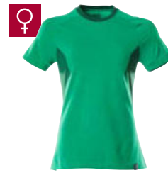
18392-959-33303 T-Shirt, Damenpassform