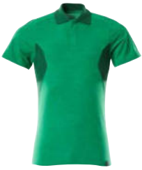
18383-961-33303 Polo-Shirt, moderne Passform