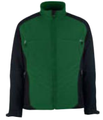
MASCOT® Dresden Soft Shell Jacke 12002-149 Seite 44