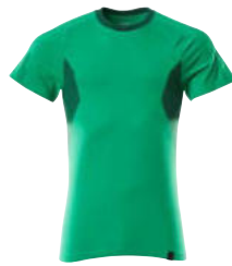
18382-959-33303 T-Shirt, moderne Passform