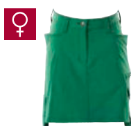
18047-511-03 DIAMOND 18247-511-03 PEARL Rock, Damenpassform, Vier-Wege- Stretchstoff, geringes Gewicht