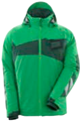
18035-249-33303 Winterjacke mit CLIMASCOT®-Futter, winddicht und wasserabweisend