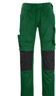
MASCOT® Lemberg Hose mit Knietaschen 13079-230 Seite 31