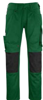
MASCOT® Mannheim Hose mit Knietaschen 12679-442 Seite 32