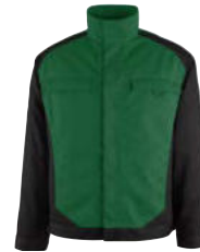
MASCOT® Fulda Jacke 12209-442 Seite 35