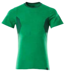
18082-250-33303 T-Shirt, moderne Passform