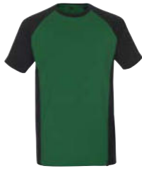
MASCOT® Potsdam T-Shirt 50567-959 Seite 49