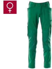
18079-511-03 Hose mit CORDURA®-Knietaschen, Vier- Wege-Stretchstoff, geringes Gewicht